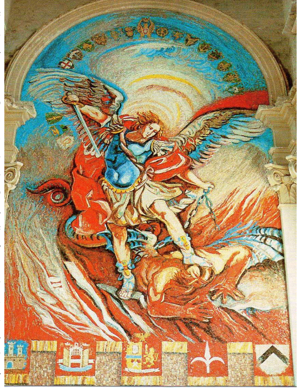
Mosaico Chiesa Campeggio

La festa di Campeggio è da sempre un incontro importantissimo che ci permette di fare un tuffo nel passato, incontrare i colleghi e gli amici, ricreare quello spirito di fratellanza e di appartenenza nel ricordo di trascorsi, belli e meno belli, della nostra vita passata al servizio dell'Istituzione Polizia; contribuendo, altresì ad avvicinare i colleghi tuttora in servizio a quelli in quiescenza, cementandone i vincoli solidaristici, determinati dall'aver indossato la stessa uniforme e servito la Patria, con eguale spirito di abnegazione, all'insegna della giustizia e della legalità. L'edizione 2016 sarà particolarmente importante anche perché consegneremo al Parroco di Campeggio, don Giovanni Driussi, quanto raccolto per il restauro del portale d'ingresso della chiesa, dimostrando ancora una volta alla comunità locale, che possiamo dire ci ha adottato, quanto abbiamo a cuore la nostra chiesa.