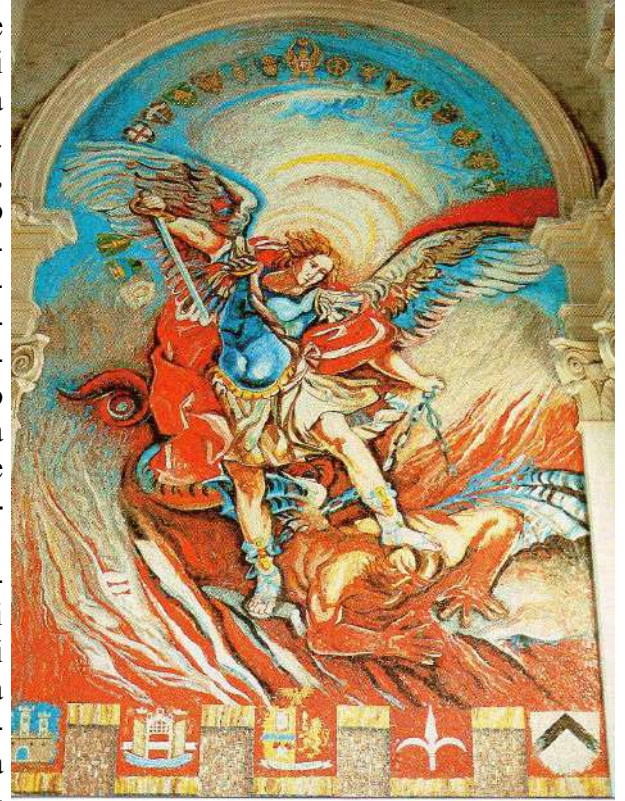
Mosaico Chiesa Campeggio

La festa di Campeggio è da sempre un incontro importantissimo che ci permette di fare un tuffo nel passato, incontrare i colleghi e gli amici, ricreare quello spirito di fratellanza e di appartenenza nel ricordo di trascorsi, belli e meno belli, della nostra vita passata al servizio dell'Istituzione Polizia; contribuendo, altresì ad avvicinare i colleghi tuttora in servizio a quelli in quiescenza, cementandone i vincoli solidaristici, determinati dall'aver indossato la stessa uniforme e servito la Patria, con eguale spirito di abnegazione, all'insegna della giustizia e della legalità. L'edizione 2016 sarà particolarmente importante anche perché consegneremo al Parroco di Campeggio, don Giovanni Driussi, quanto raccolto per il restauro del portale d'ingresso della chiesa, dimostrando ancora una volta alla comunità locale, che possiamo dire ci ha adottato, quanto abbiamo a cuore la nostra chiesa.