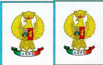
CHIUCH Gino MUSTO Salvatore